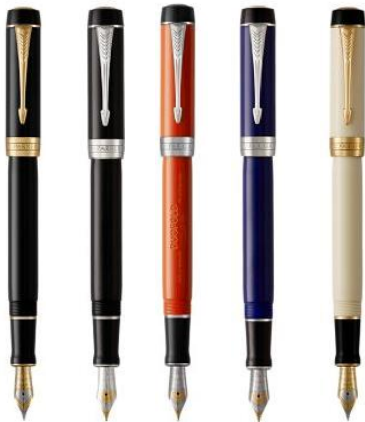
Базовый ассортимент – акрил