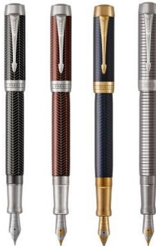
Престижный ассортимент – основа из металла